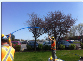
• Extensomètre multipoints en forage