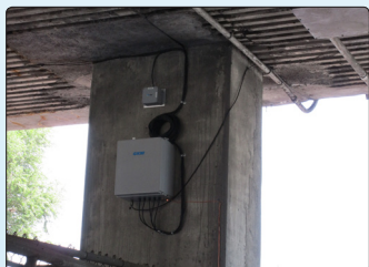
• Surveillance de l'inclinaison des colonnes de l'autoroute 40