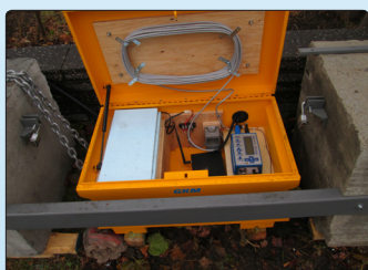
• Station de mesure de son et vibration