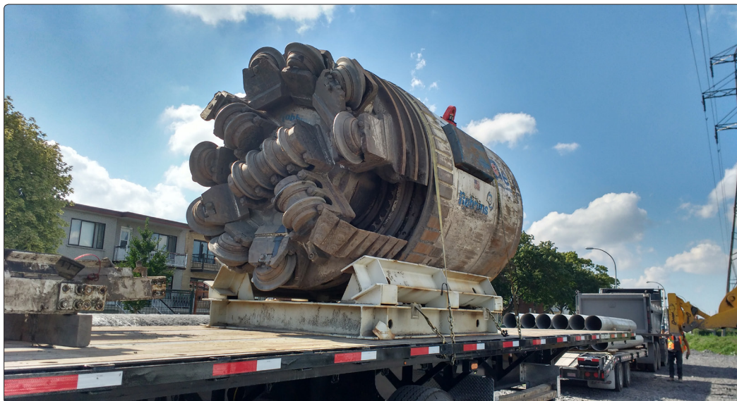
• Tête du tunnelier

Le projet du tunnel Jarry s'inscrit dans la décision de l'administration de la Ville de Montréal de sécuriser l'alimentation en eau potable de certains secteurs critiques. Une partie de ce projet comprend l'installation d'une conduite d'eau de 1200 mm de diamètre en tunnel sur une distance de 4,1 km dans l'axe de la rue Jarry et de la 24 e Avenue. À l'automne 2015, GKM Consultants a été mandatée pour la fourniture et l'installation d'instruments géotechniques afin de mesurer les mouvements du sol et des structures existantes durant et après le passage du tunnelier. Par ailleurs, le mandat de GKM comprenait l'assistance pour la surveillance et le contrôle des sons et vibration causés par les travaux, ainsi que la fourniture de stations autonomes de mesure.